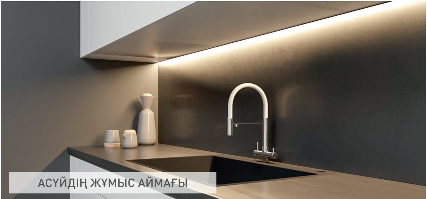
АСҮЙДІҢ ЖҰМЫС АЙМАҒЫ

Жарықдиодты таспа - бұл асүйдің жұмыс аймағын қосымша жарықтандырудың танымал тәсілі, өйткені бұл жиі жайлылықпен қатар, қауіпсіздікпен де байланысты. Таспаны таңдаған кезде CRI – түс беру индексіне назар аудару маңызды. Бұл таспаның жарығы астында әр түрлі түстердің қаншалықты табиғи көрінетінін көрсетеді және, әрине, мұндай көрсеткіш мүмкіндігінше жоғары болуы керек. Сонымен қатар, пайдаланушының қалауы бойынша таспа сәндік сипатта қолданылуы мүмкін. Таспаны монтаждау арнайы дағдыларды қажет етпейді, оны өздігінен жүзеге асыруға болады.