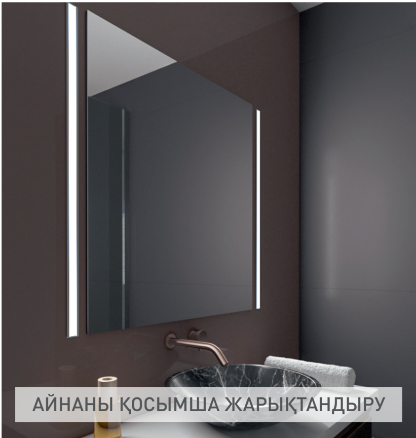
АЙНАНЫ ҚОСЫМША ЖАРЫҚТАНДЫРУ

Айнаны қосымша жарықтандыру айналада жұмсақ жарық-көлеңке ореолын жасай отырып, сәндік сипатқа ие болуы мүмкін және функционалды рөл атқара алады. 4000K түстік температурасы (және түс берудің жақсы индексі) бар жарықдиодты таспаны пайдаланған кезде қыздар макияжды қолданған кезде табиғи түс беруді бағалайды, ал ер адамдар қырыну кезінде визуалды жайлылықтың жоғарылағанын атап өтеді.