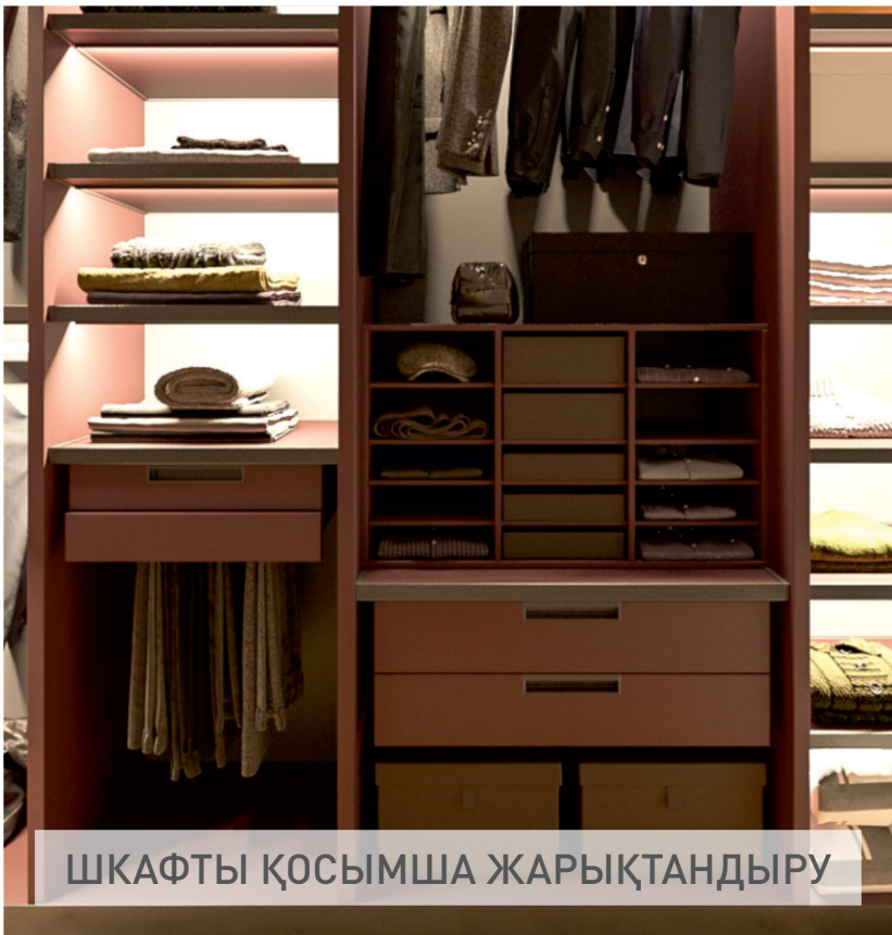
ШКАФТЫ ҚОСЫМША ЖАРЫҚТАНДЫРУ

Пәтерде шкаф жиі ең қараңғы жерде тұрады, сонымен қатар сөрелер бір-бірін қараңғылайды, сондықтан заттарды іздеу үшін жалпы жарықты қосу керек - бұл әрқашан ыңғайлы бола бермейді. Шкафтың есіктеріндегі немесе сөрелеріндегі жарықдиодты қосымша жарықтандыру бұл мәселені шешуге көмектеседі. Мұндай жарықтандыруды ажыратқыштың классикалық пернесі арқылы, сонымен қатар қозғалыс немесе есіктерді ашу/жабу бергіштері көмегімен ұйымдастыруға болады – бәрі Сіздің қажеттіліктеріңізге байланысты.